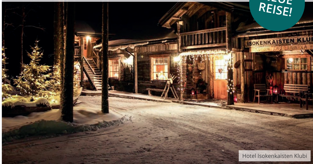
Hotel Isokenkaisten Klubi