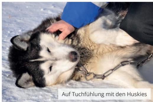
Auf Tuchfühlung mit den Huskies