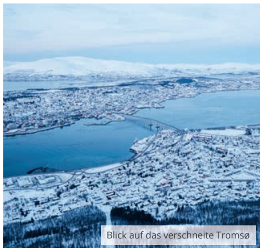
Blick auf das verschneite Tromsø