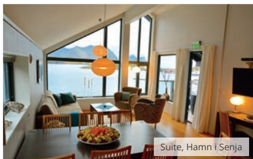
Suite, Hamn i Senja