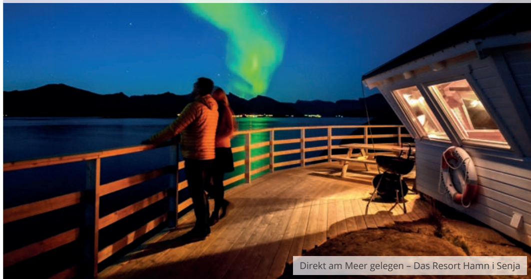
Direkt am Meer gelegen – Das Resort Hamn i Senja