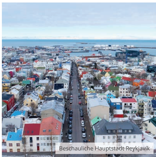
Beschauliche Hauptstadt Reykjavik