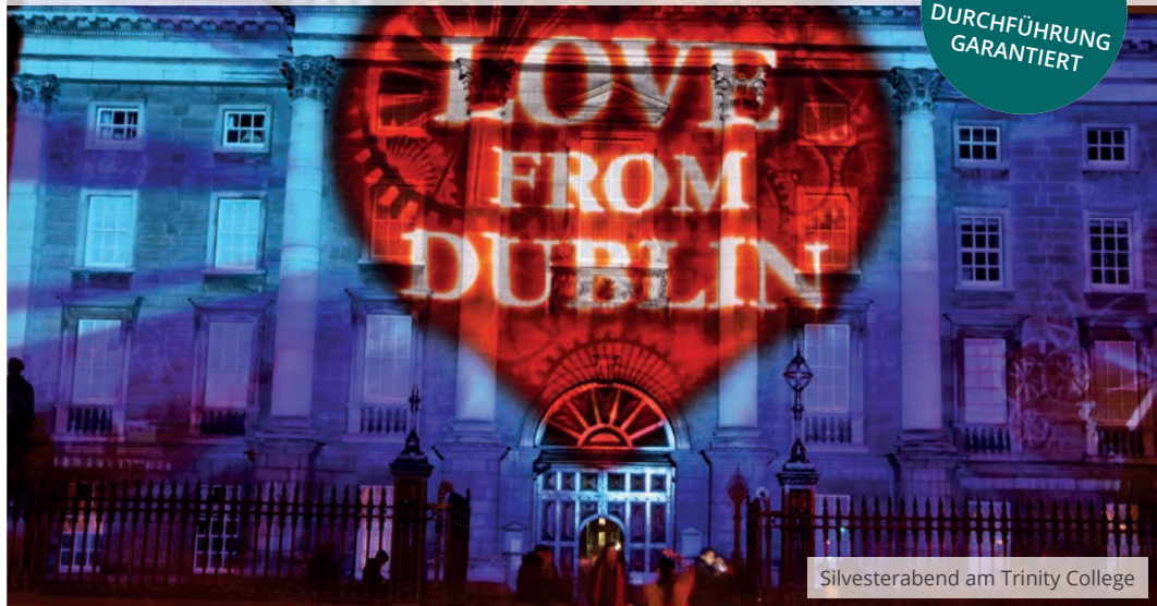
Silvesterabend am Trinity College