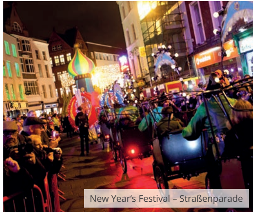
New Year's Festival – Straßenparade