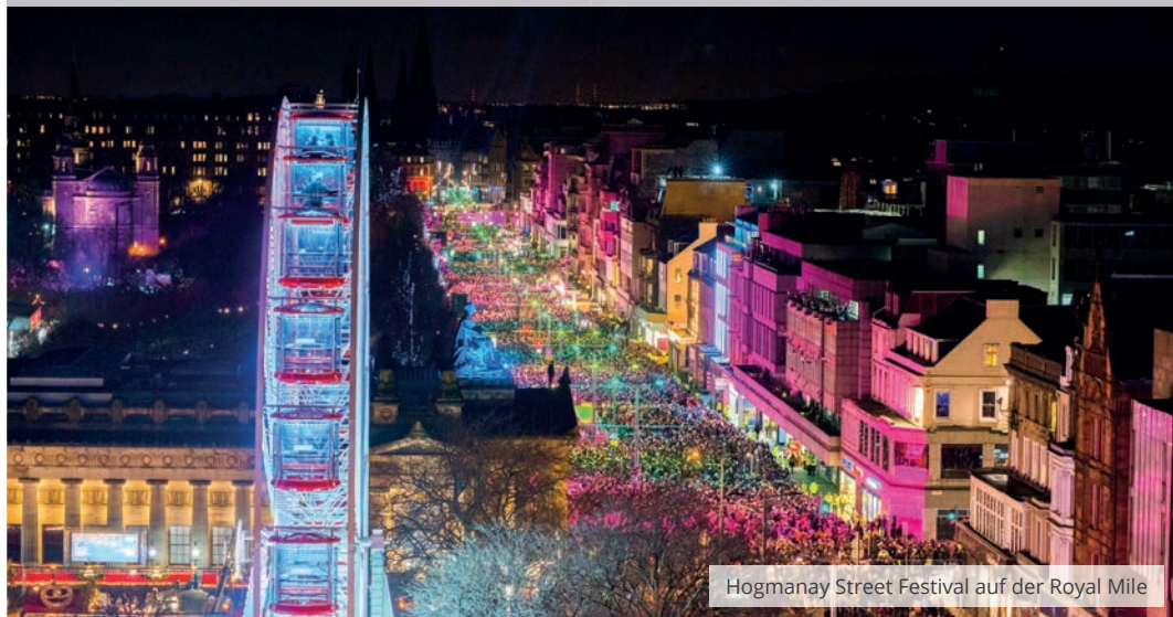
Hogmanay Street Festival auf der Royal Mile

5 TAGE | AB 1.295,- € | 🧑‍👤 10 BIS 20 GÄSTE | ✈️ INKL. FLUG