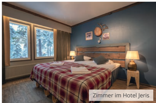
Zimmer im Hotel Jeris