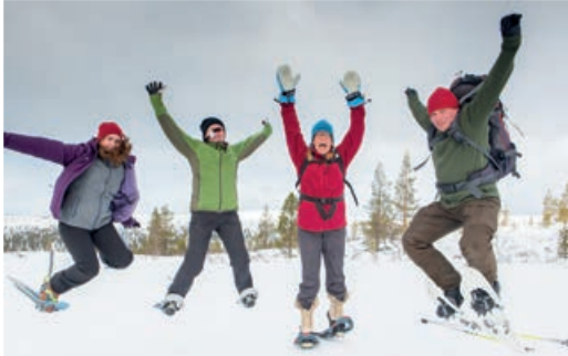
Spaß bei einer Schneeschuhwanderung