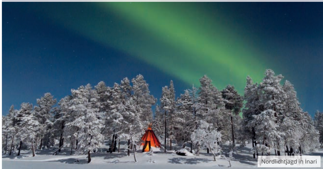
Nordlichtjagd in Inari