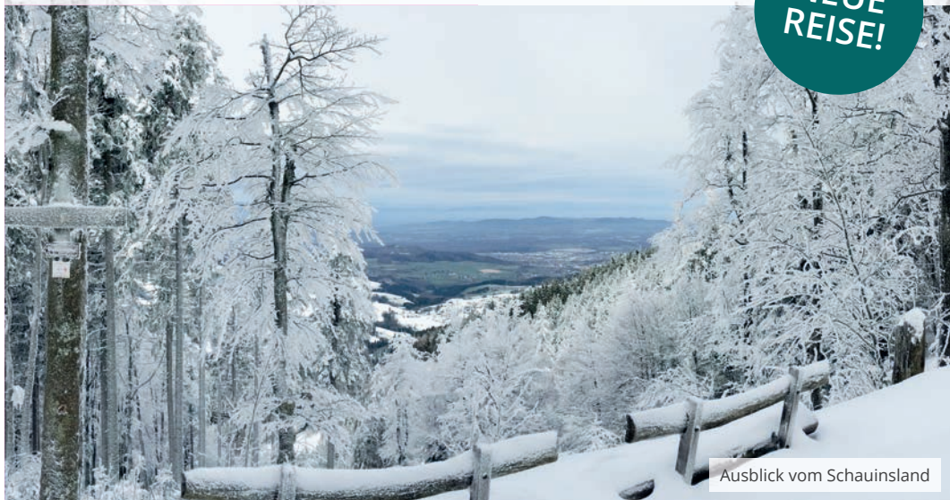
Ausblick vom Schauinsland