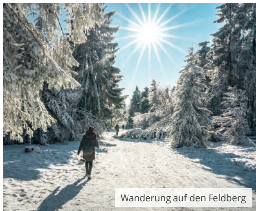
Wanderung auf den Feldberg