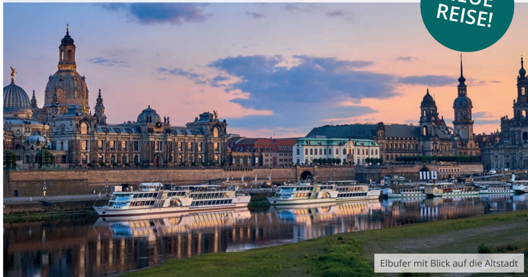
Elbufer mit Blick auf die Altstadt