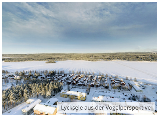
Lycksele aus der Vogelperspektive