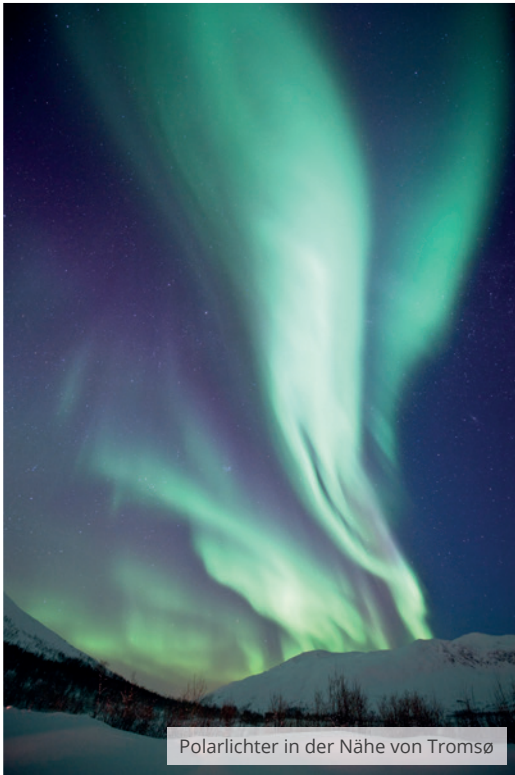
Polarlichter in der Nähe von Tromsø