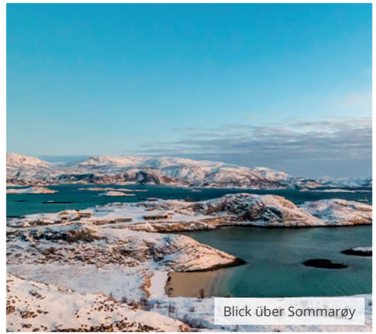
Blick über Sommarøy