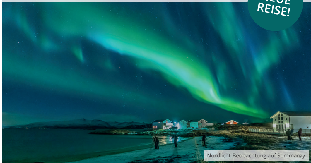
Nordlicht-Beobachtung auf Sommarøy