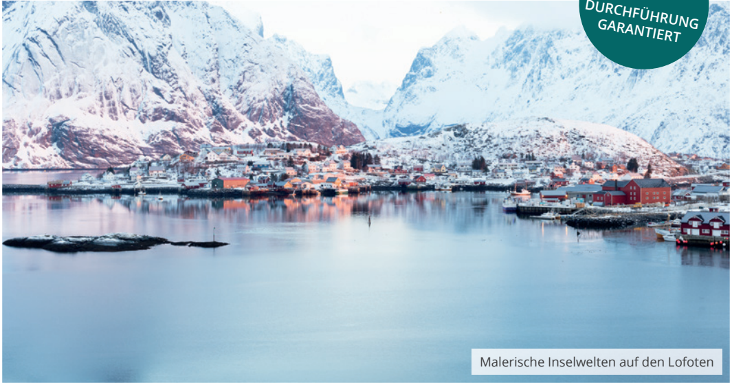
Malerische Inselwelten auf den Lofoten