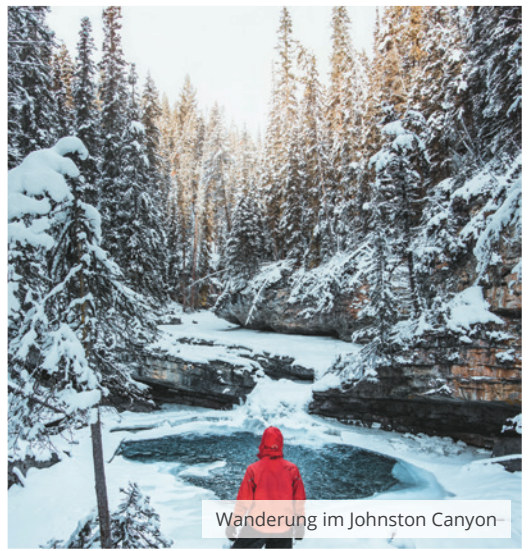
Wanderung im Johnston Canyon