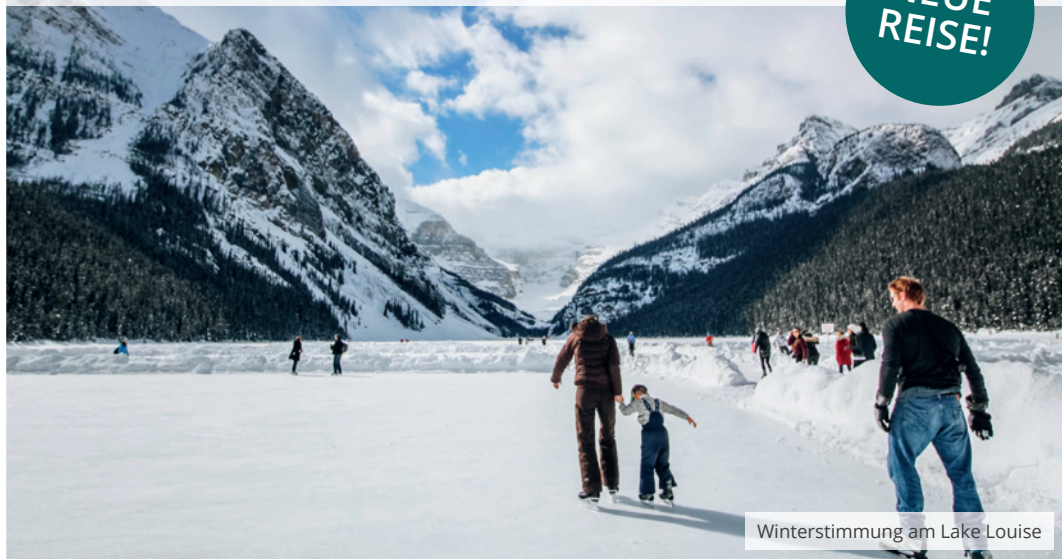
Winterstimmung am Lake Louise