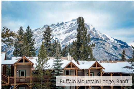
Buffalo Mountain Lodge, Banff