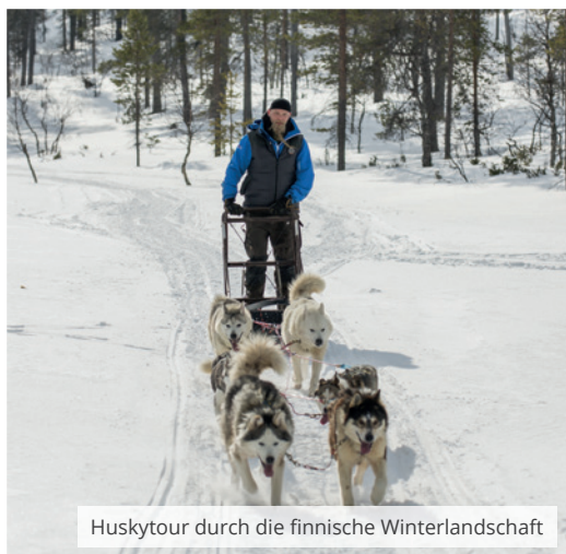
Huskytour durch die finnische Winterlandschaft