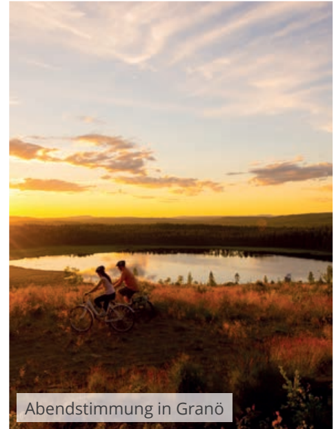
Abendstimmung in Granö