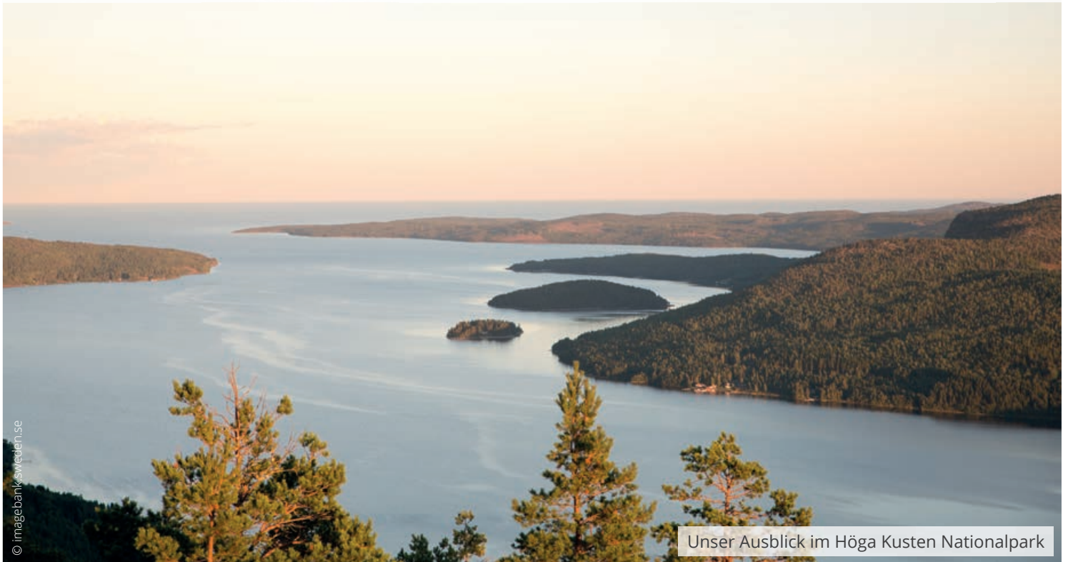
Unser Ausblick im Höga Kusten Nationalpark