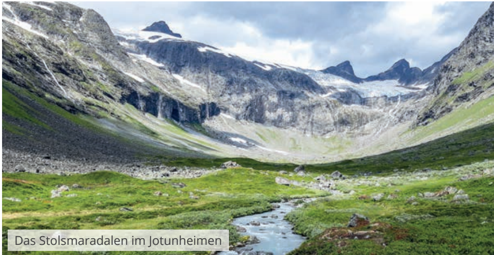
Das Stolsmaradalen im Jotunheimen