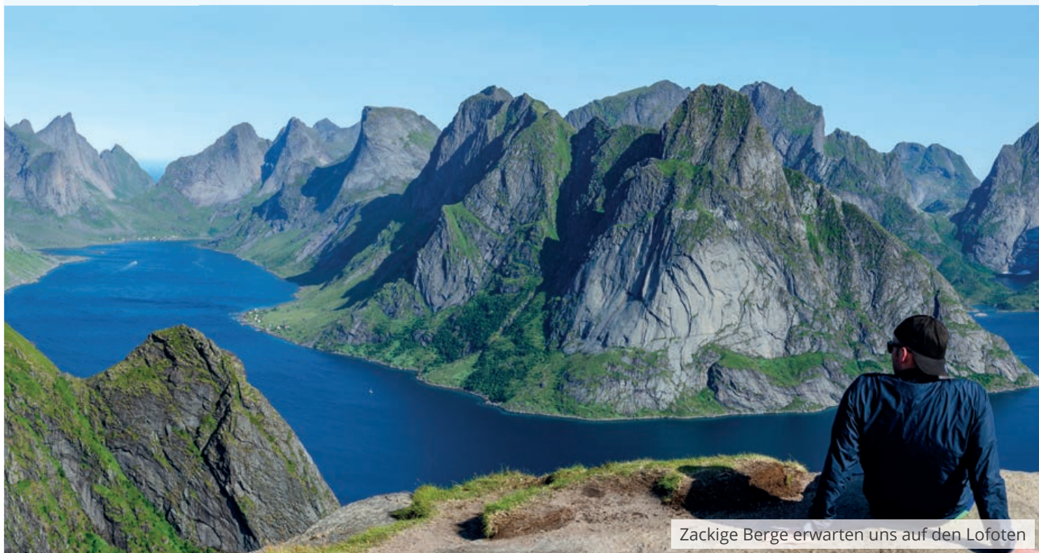
Zackige Berge erwarten uns auf den Lofoten