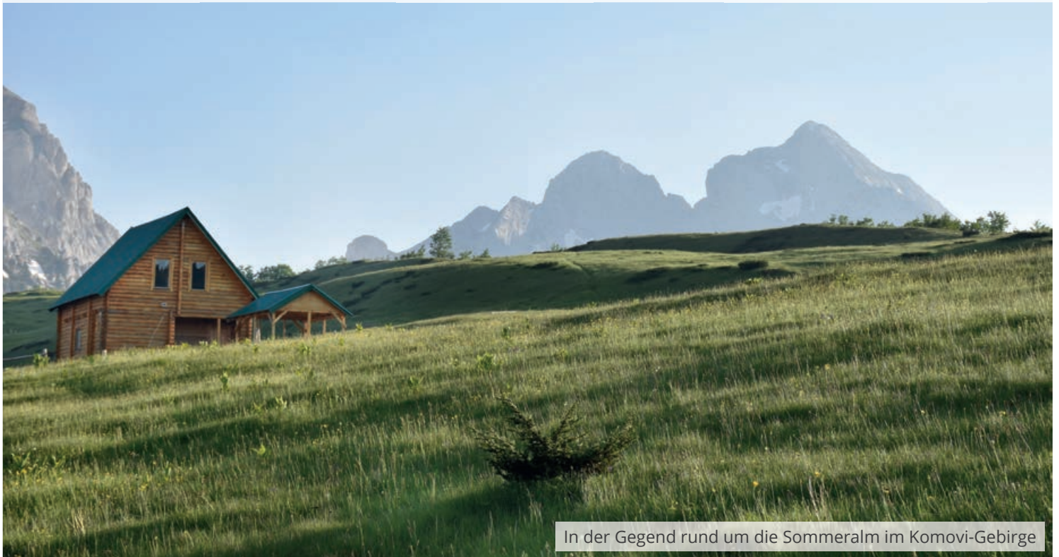
In der Gegend rund um die Sommeralm im Komovi-Gebirge