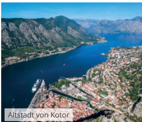
Altstadt von Kotor

Die wilde Schönheit Montenegros zeigt sich, wenn man den Norden des Landes bereist: