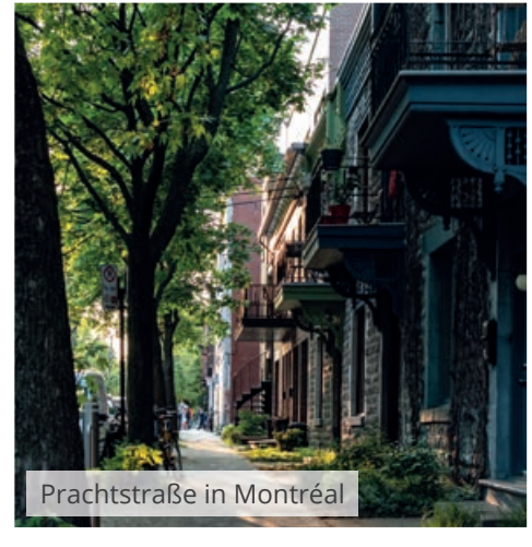
Prachtstraße in Montréal