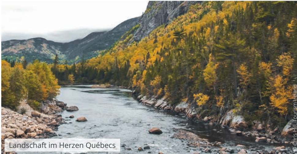
Landschaft im Herzen Québeccs