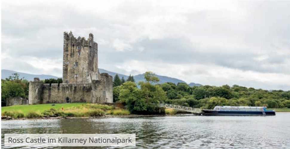
Ross Castle im Killarney Nationalpark