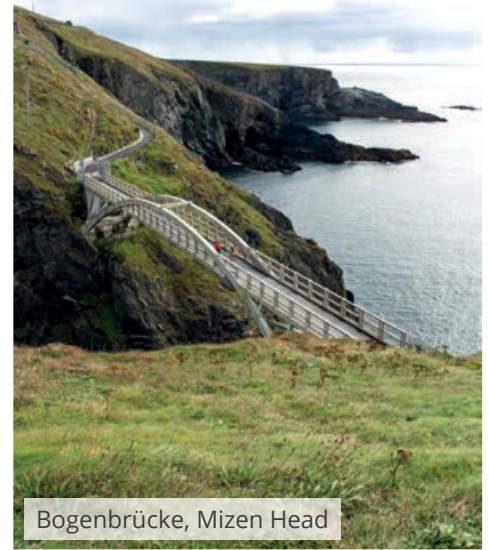
Bogenbrücke, Mizen Head