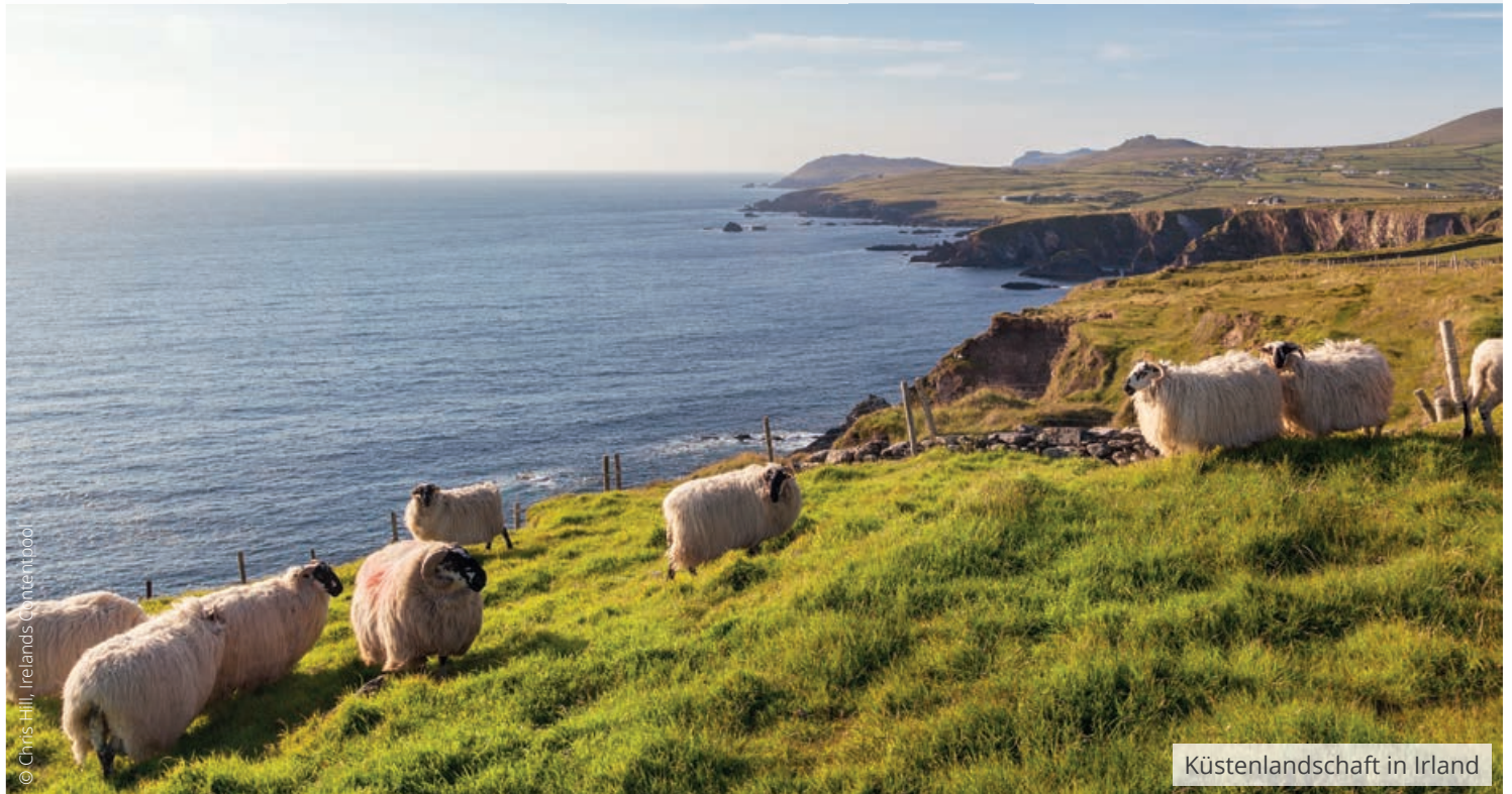
Küstenlandschaft in Irland