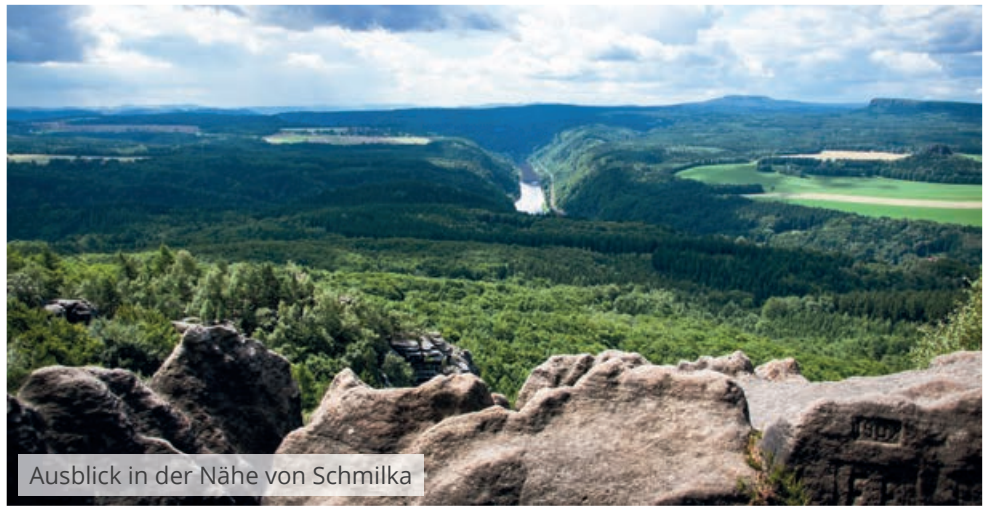
Ausblick in der Nähe von Schmilka