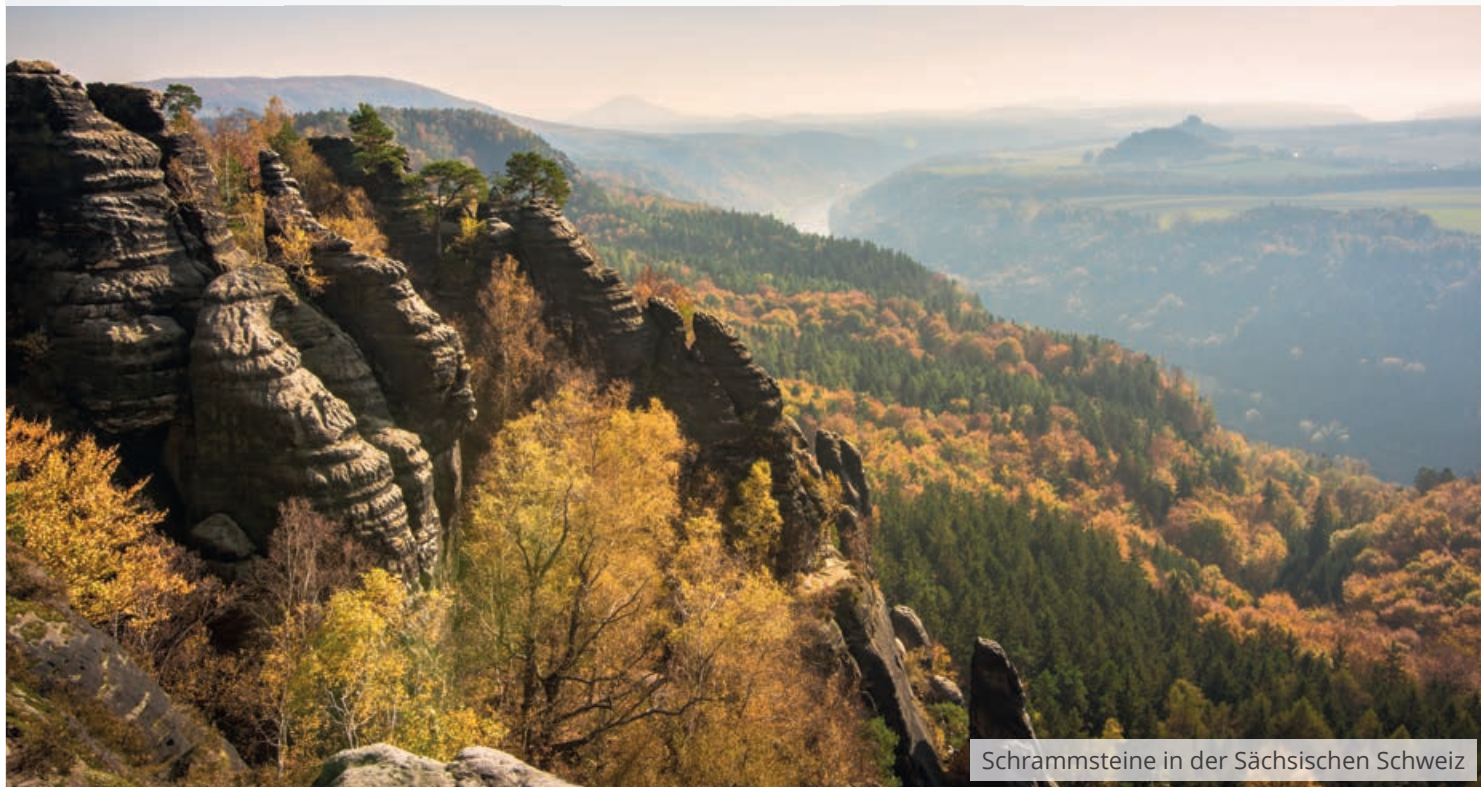
Schrammsteine in der Sächsischen Schweiz