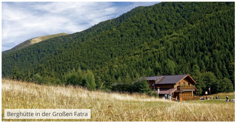
Berghütte in der Großen Fatra