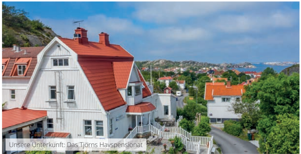
Unsere Unterkunft: Das Tjörns Havspensionat