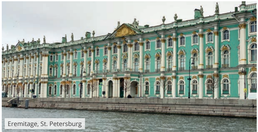
Eremitage, St. Petersburg