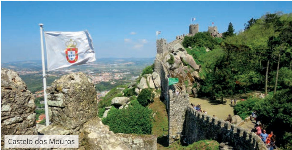
Castelo dos Mouros