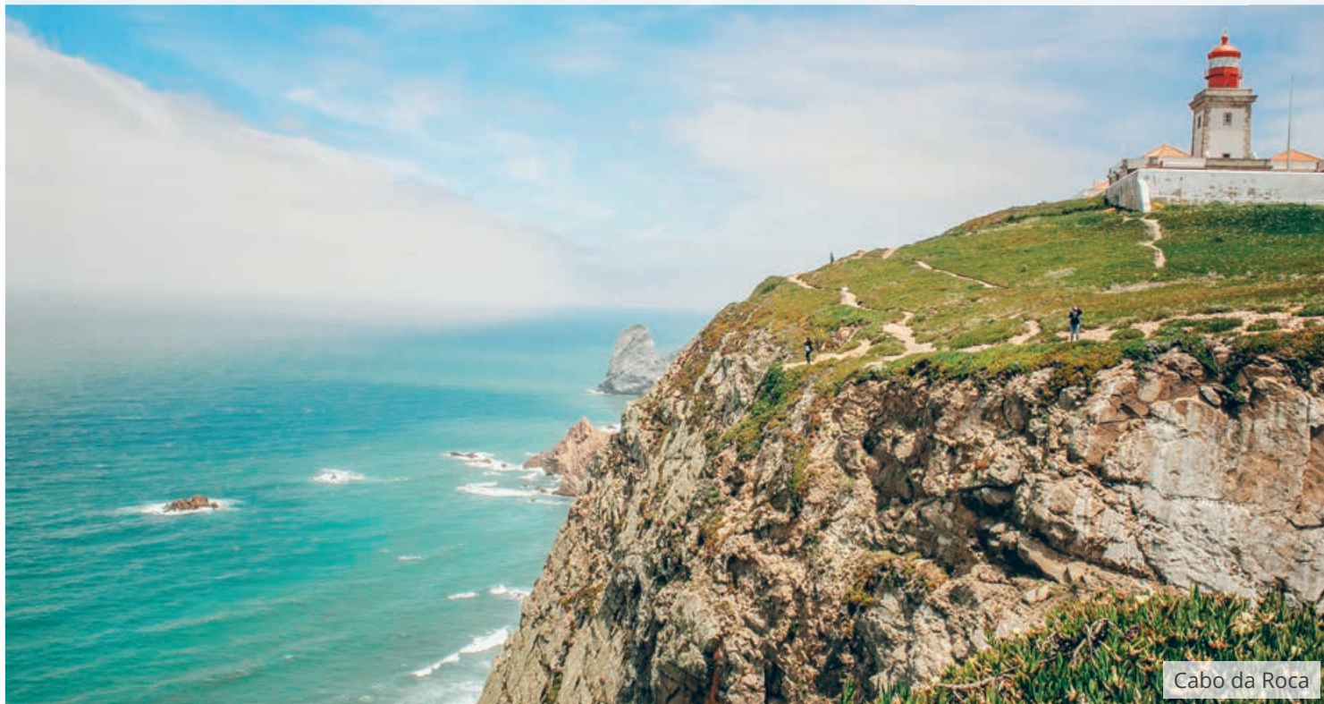
Cabo da Roca