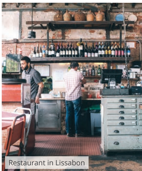
Restaurant in Lissabon

Wenn man durch den Naturpark Sintra-Cascais wandert, kommt man aus dem Staunen gar nicht mehr heraus. Nicht nur Mönche haben hier Klöster gebaut und ihre Einsiedeleien hinterlassen, auch zahlreiche Adlige und Könige haben schon früh den Reiz der westlichsten Region Portugals kennen- und liebgelernt.