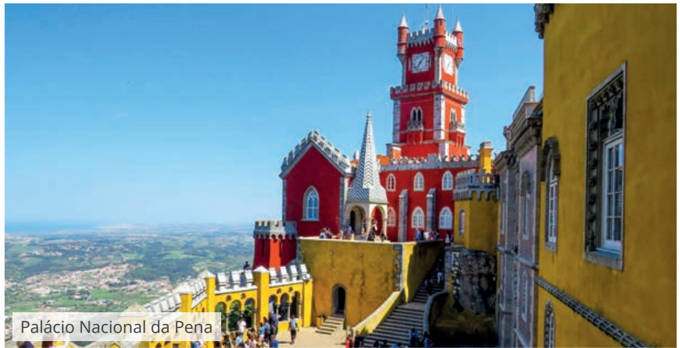
Palácio Nacional da Pena