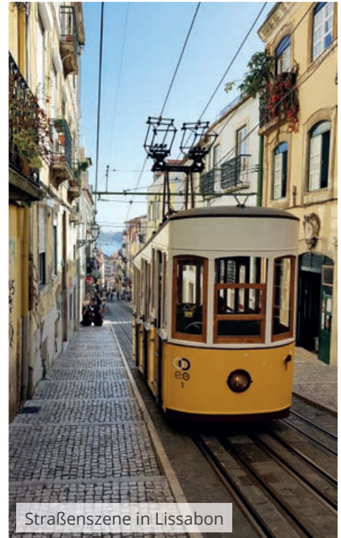
Straßenszene in Lissabon