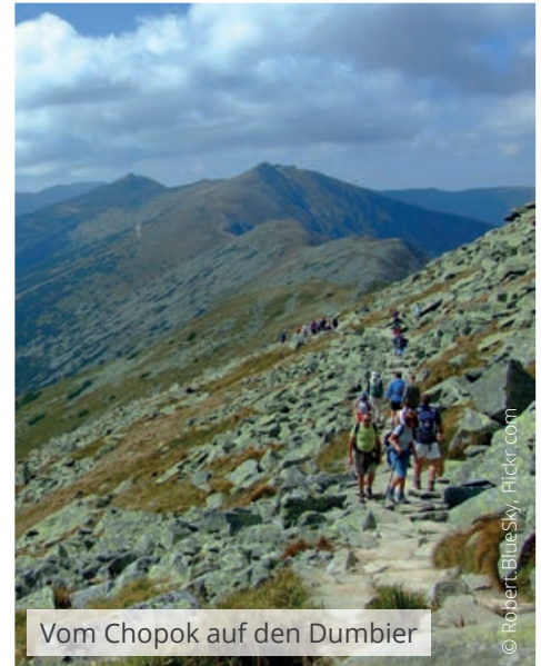
Vom Chopok auf den Dumbier