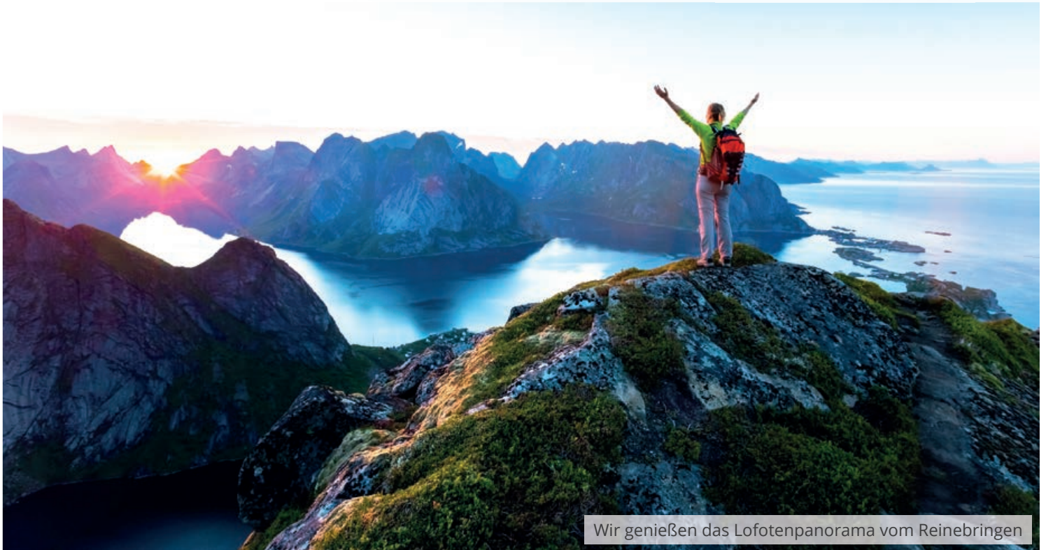
Wir genießen das Lofotenpanorama vom Reinebringen