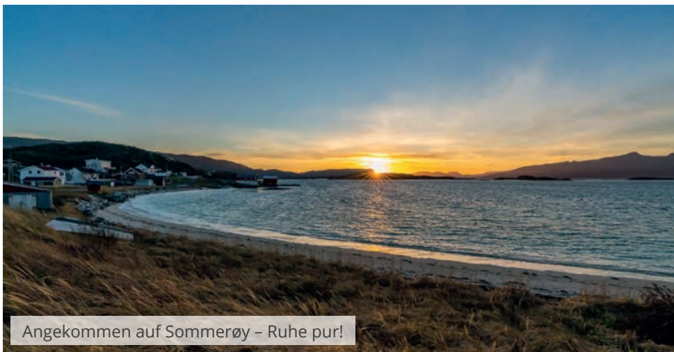
Angekommen auf Sommerøy – Ruhe pur!