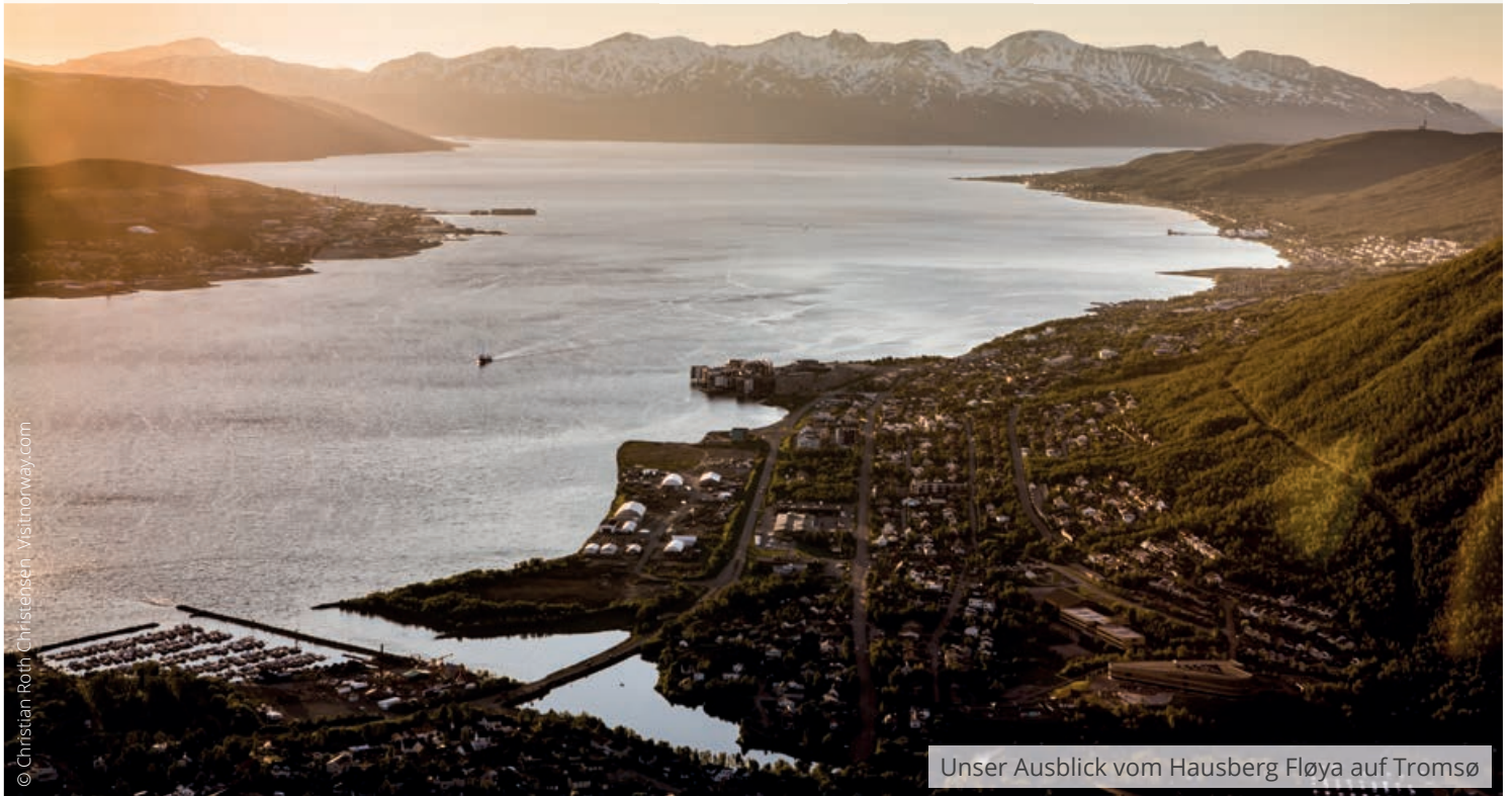
Unser Ausblick vom Hausberg Fløya auf Tromsø