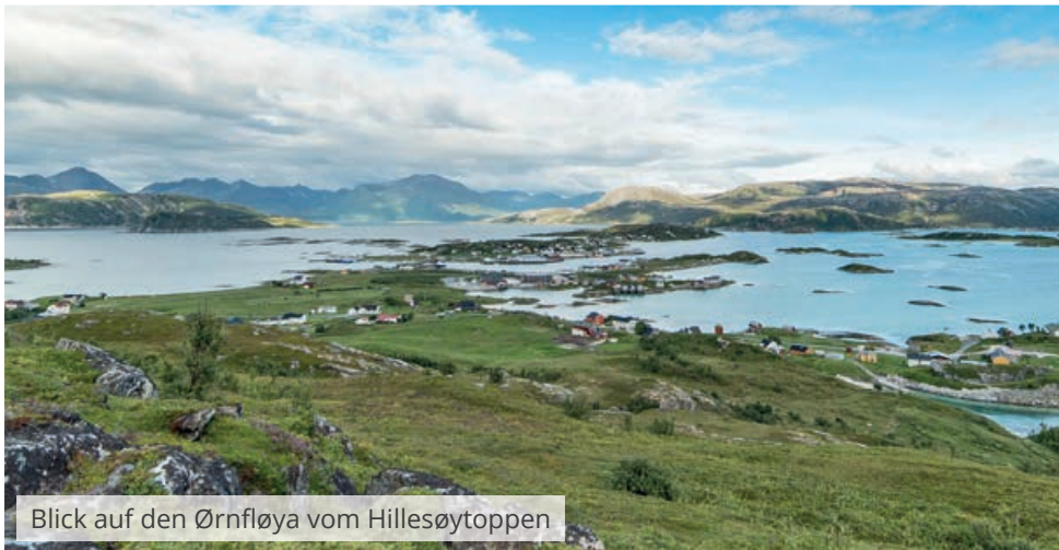
Blick auf den Ørnfløya vom Hillesøytoppen