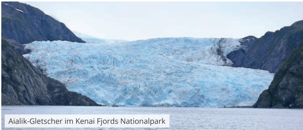
Aialik-Gletscher im Kenai Fjords Nationalpark