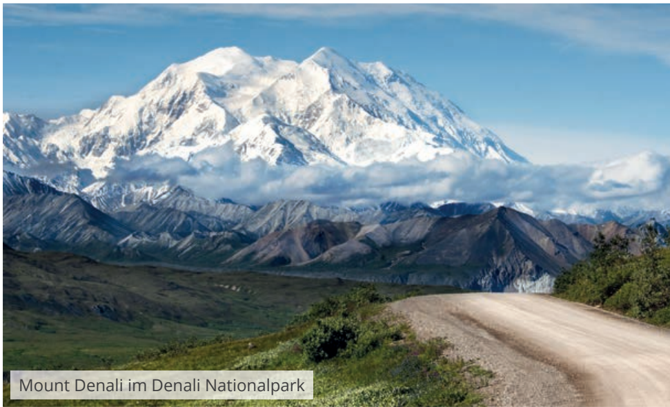
Mount Denali im Denali Nationalpark