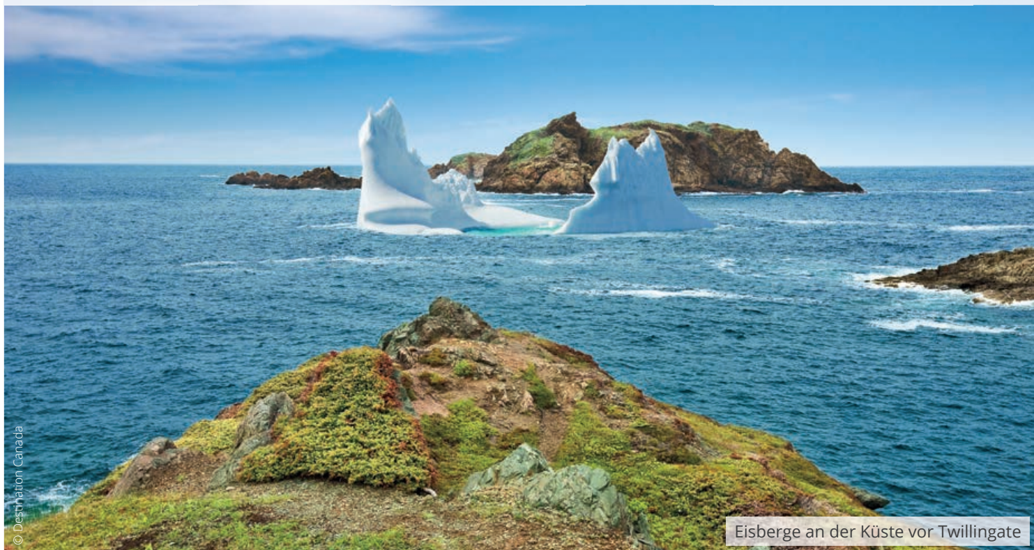
Eisberge an der Küste vor Twillingate