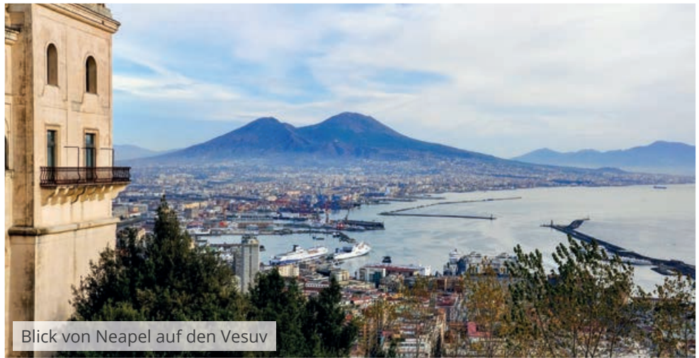
Blick von Neapel auf den Vesuv