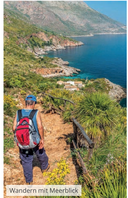
Wandern mit Meerblick