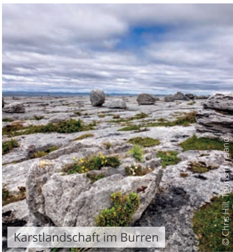
Karstlandschaft im Burren