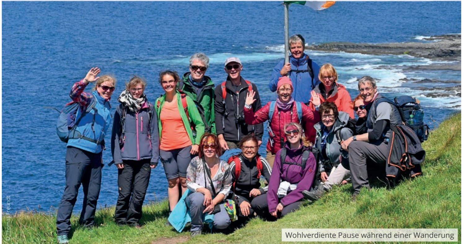
Wohlverdiente Pause während einer Wanderung