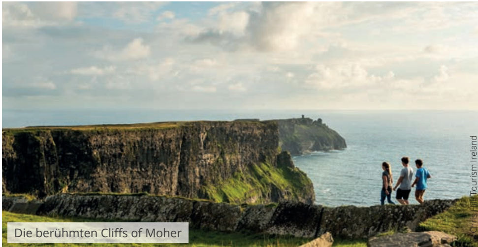
Die berühmten Cliffs of Moher