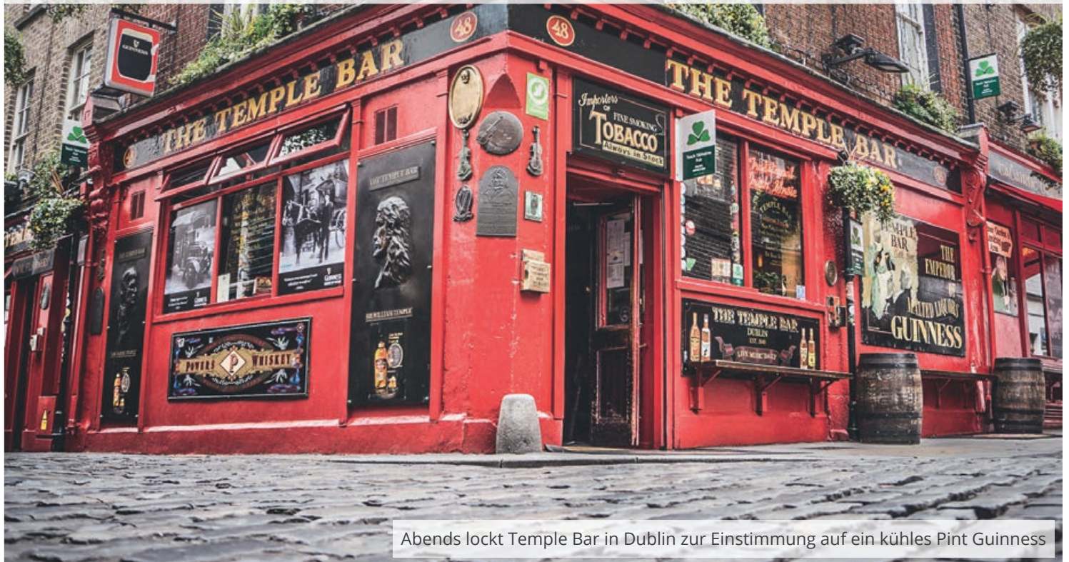
Abends lockt Temple Bar in Dublin zur Einstimmung auf ein kühles Pint Guinness