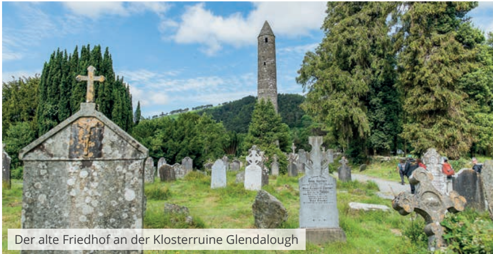
Der alte Friedhof an der Klosteruine Glendalough