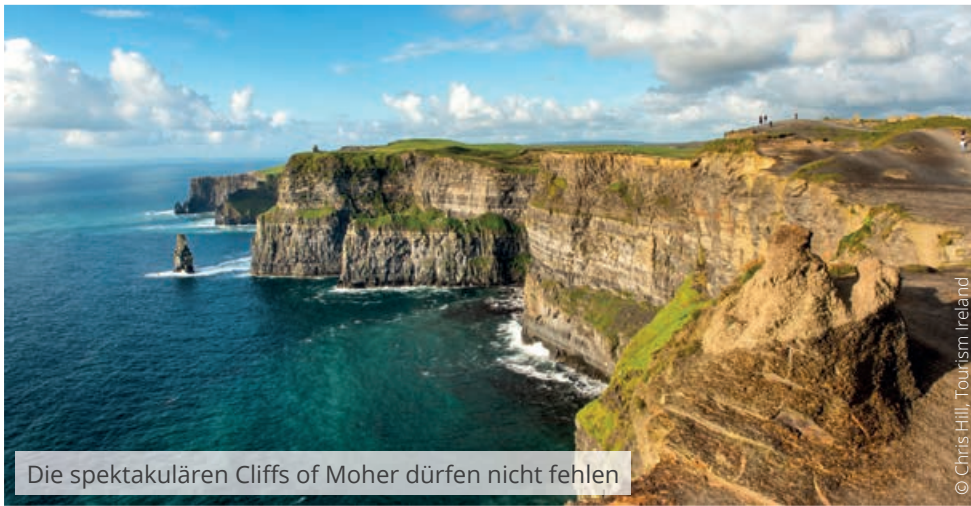
Die spektakulären Cliffs of Moher dürfen nicht fehlen