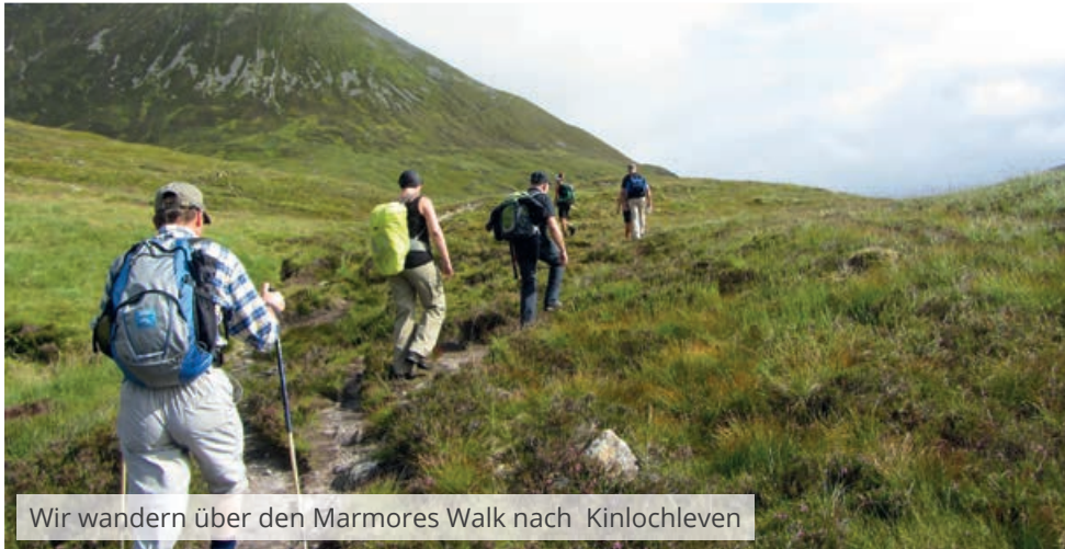
Wir wandern über den Marmores Walk nach Kinlochleven