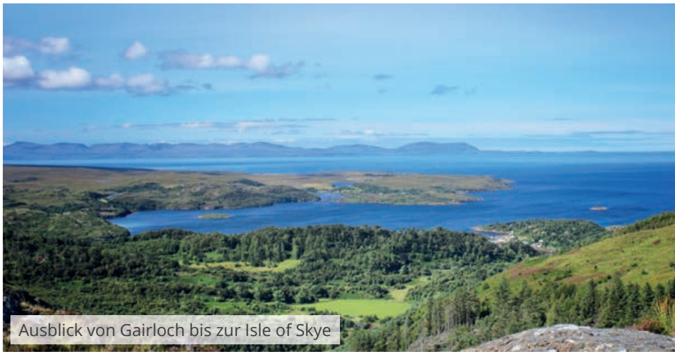
Ausblick von Gairloch bis zur Isle of Skye