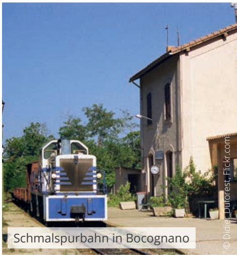
Schmalspurbahn in Bocognano