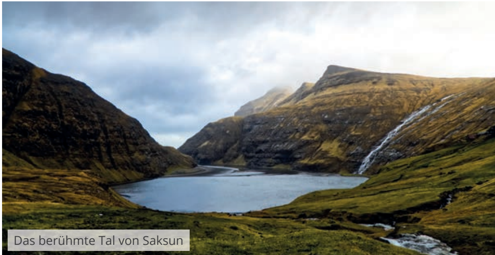
Das berühmte Tal von Saksun