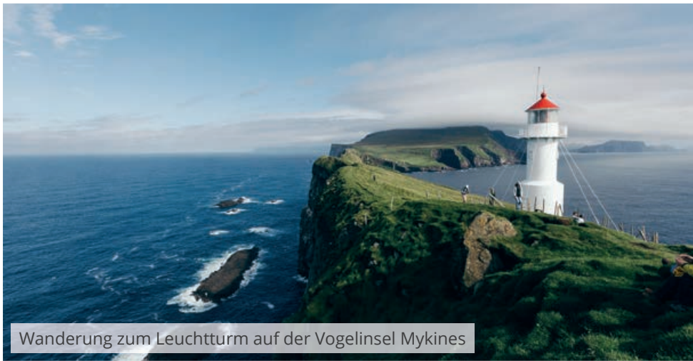
Wanderung zum Leuchtturm auf der Vogelinsel Mykines