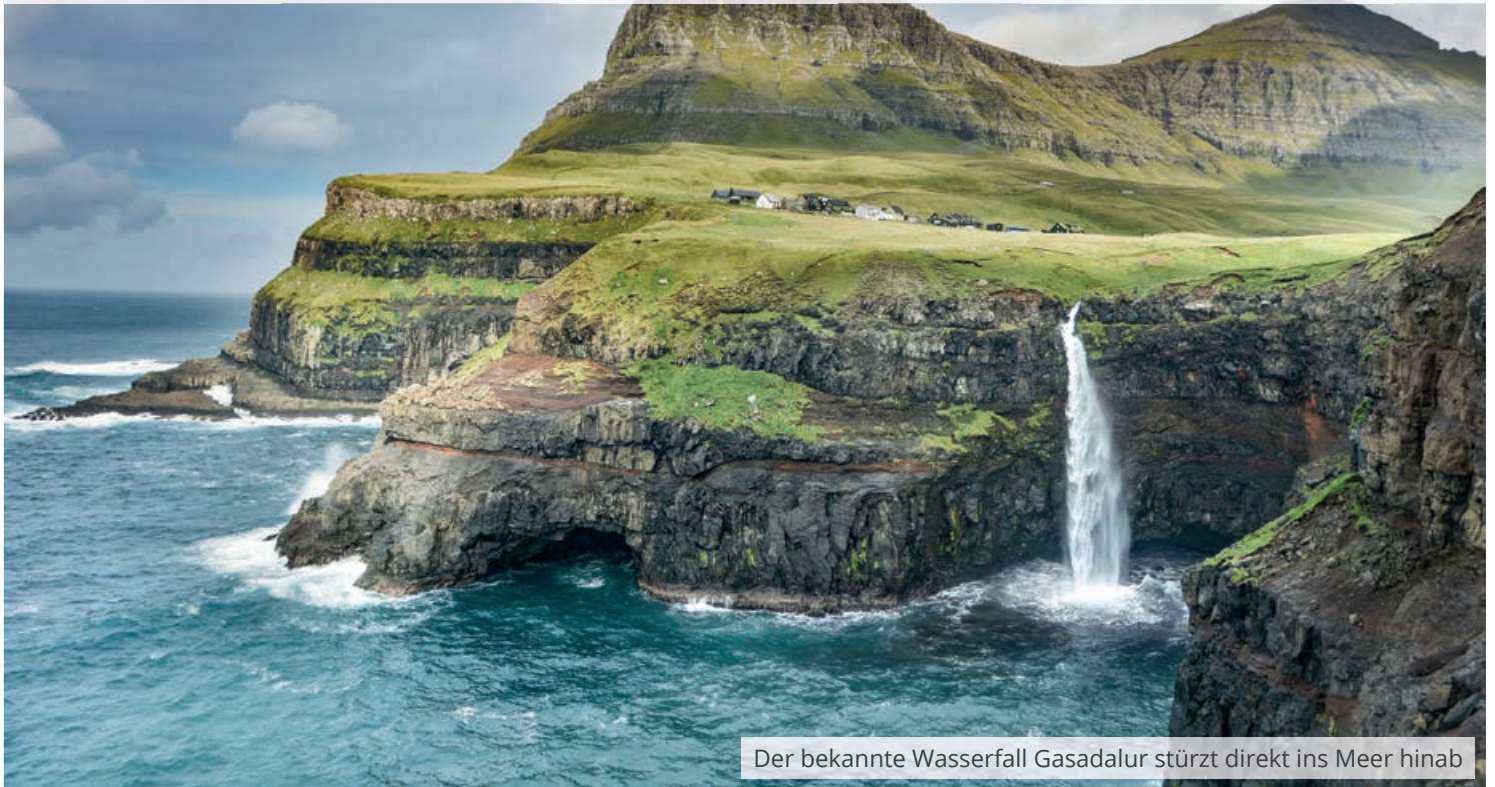
Der bekannte Wasserfall Gasadalur stürzt direkt ins Meer hinab