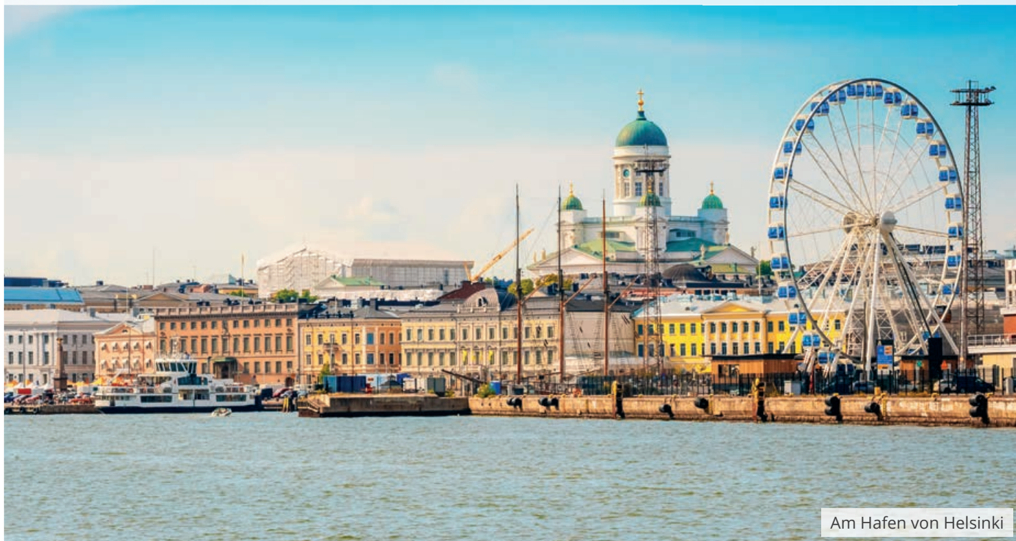
Am Hafen von Helsinki