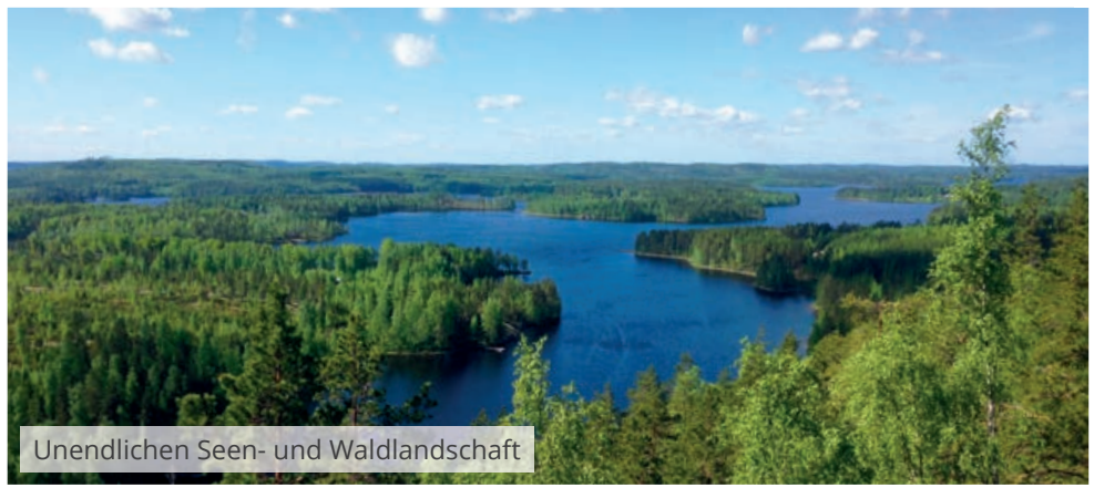
Unendlichen Seen- und Waldlandschaft