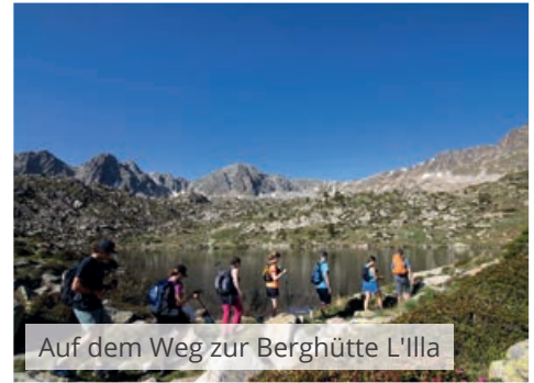
Auf dem Weg zur Berghütte L'Illa