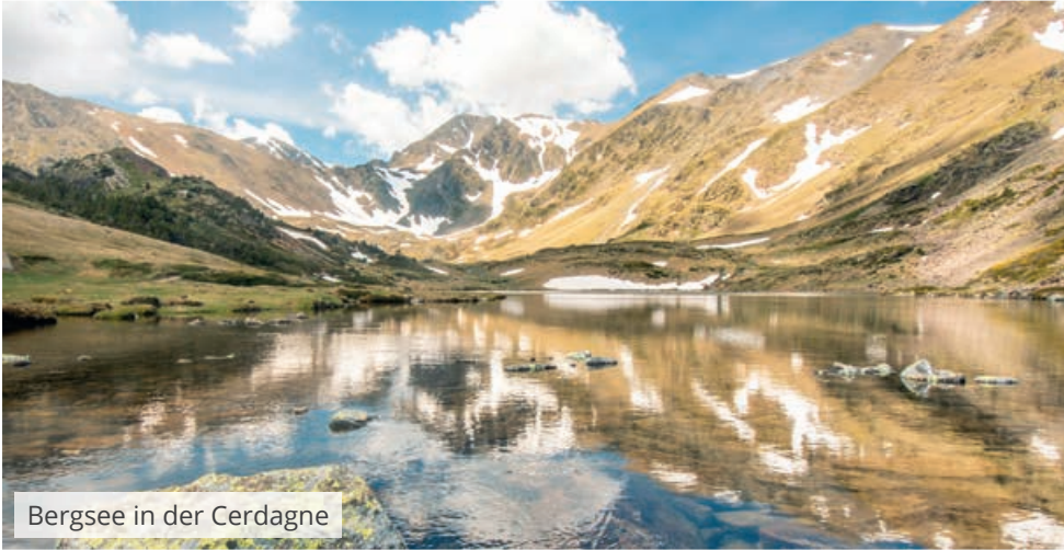
Bergsee in der Cerdagne