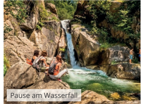
Pause am Wasserfall