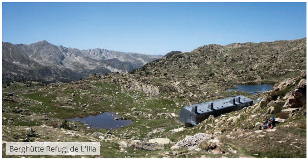
Berghütte Refugi de L'Illa