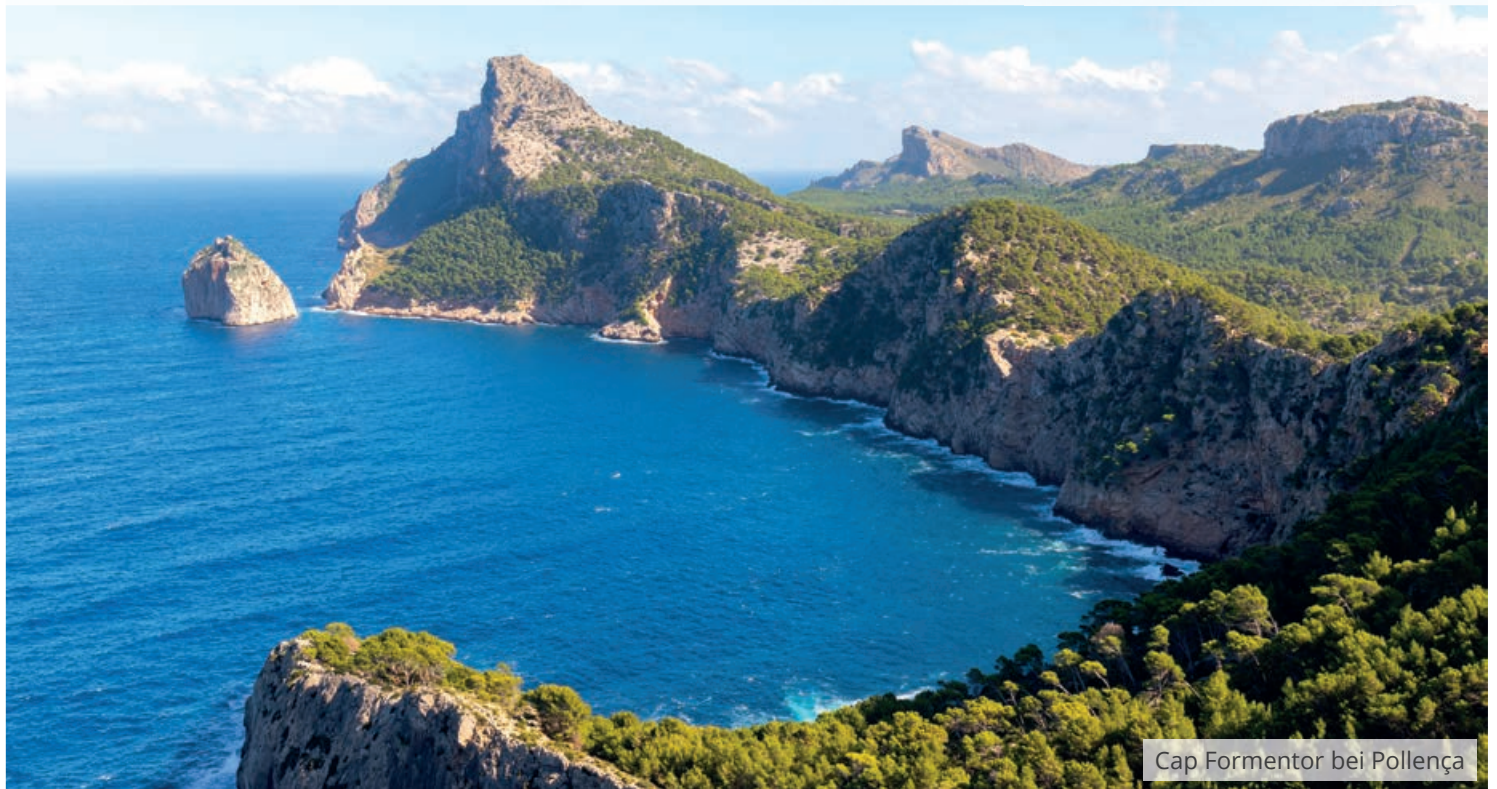
Cap Formentor bei Pollença