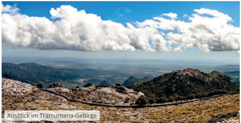
Ausblick im Tramuntana-Gebirge