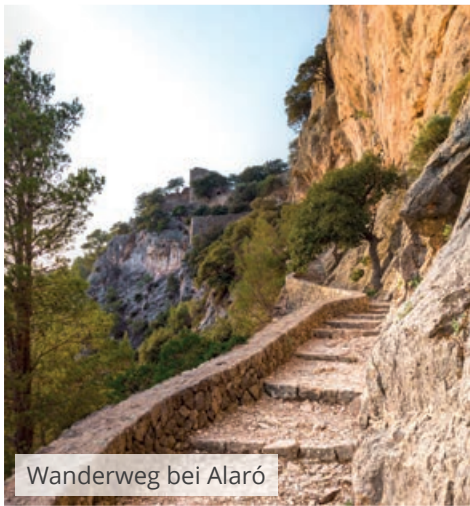
Wanderweg bei Alaró