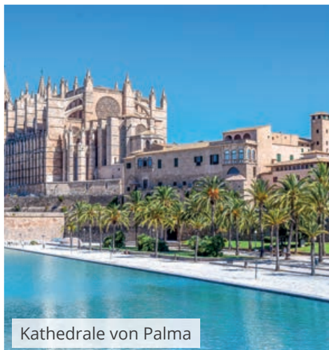
Kathedrale von Palma

Wir erleben die bekannte Baleareninsel Mallorca abseits der Touristenzentren und wandern auf klassischen Routen durch das traumhafte Gebirge und UNESCO-Welterbe "Serra de Tramuntana".