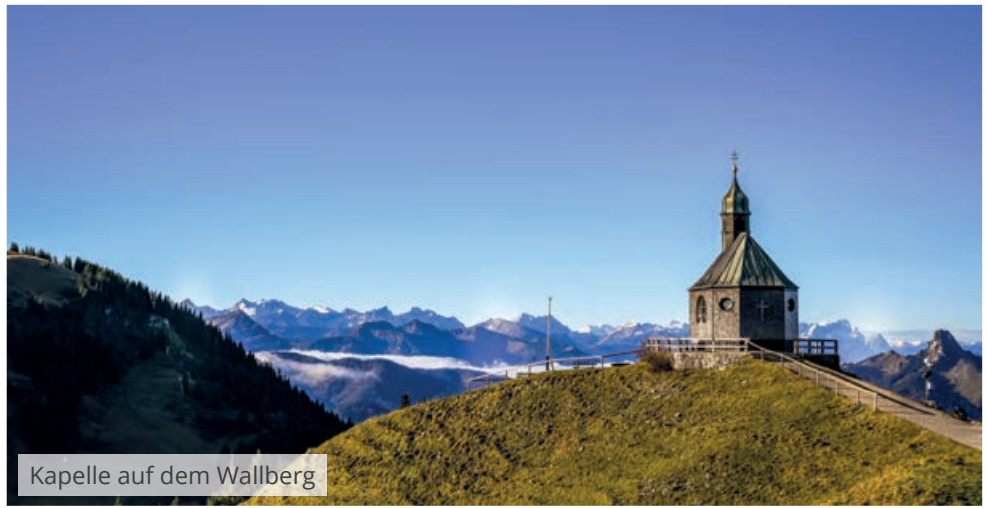
Kapelle auf dem Wallberg