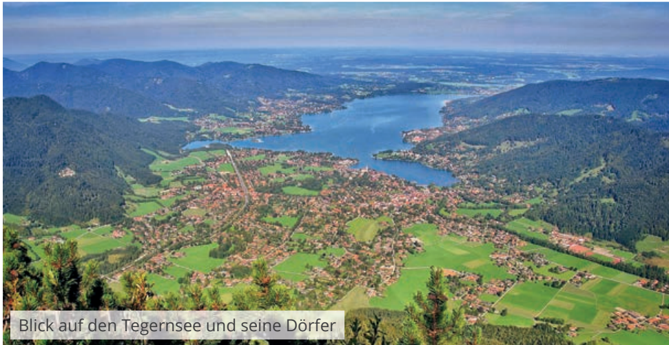
Blick auf den Tegernsee und seine Dörfer