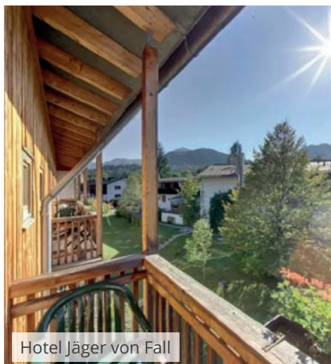
Hotel Jäger von Fall

Das Karwendel ist das größte Naturschutzgebiet der Tiroler Ostalpen und beeindruckt mit seinen mächtigen Bergketten. Nur ein Teil des Naturschutzgebietes liegt auf deutscher Seite und ist Ausgangspunkt für unsere Wanderwoche.