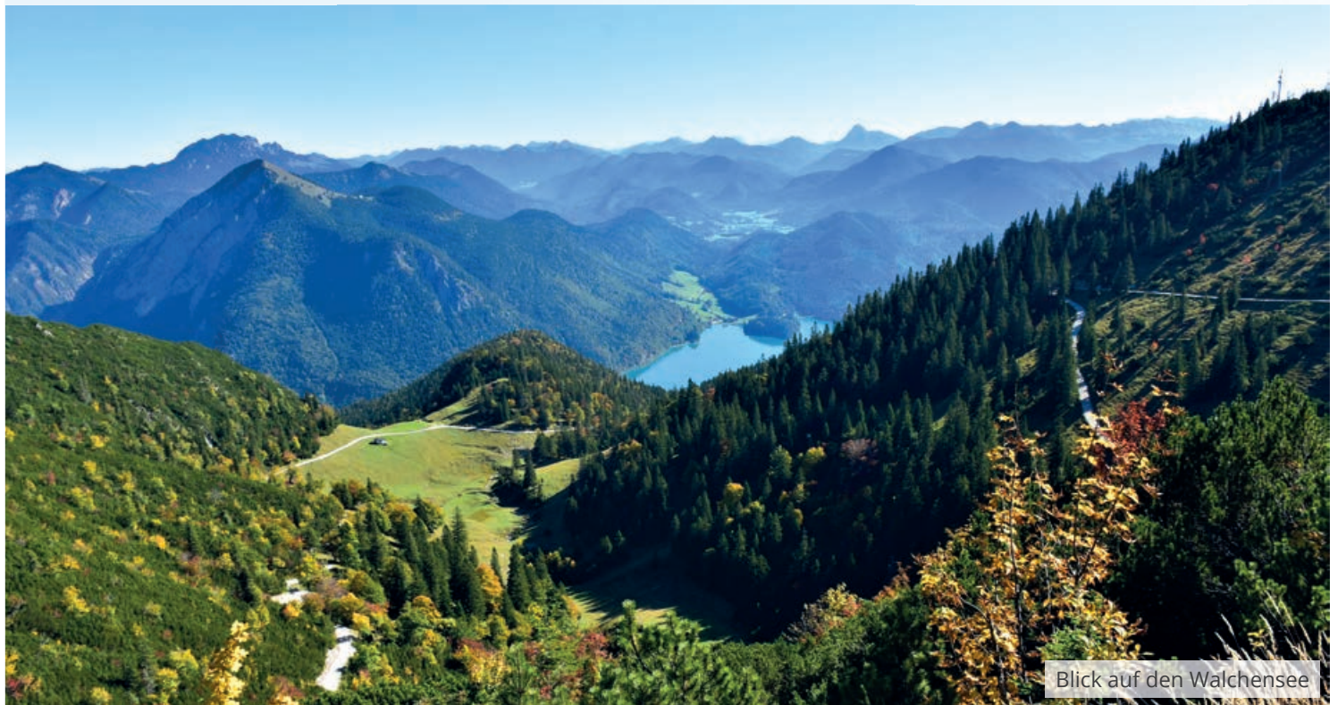
Blick auf den Walchensee