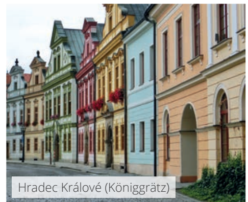
Hradec Králové (Königgrätz)

Jetzt auf www.highlaender.de/CZ8-BSW und in Ihrem Reisebüro : Detailverlauf, Buchung & Infos – auch für Alleinreisende im halben Zweibettzimmer!