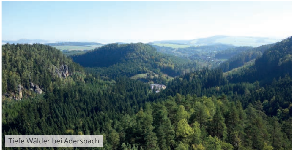
Tiefe Wälder bei Adersbach