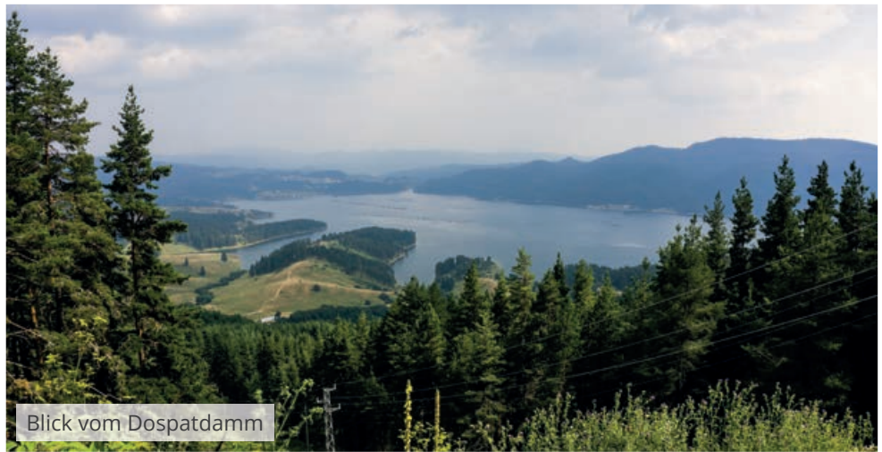
Blick vom Dospatdamm