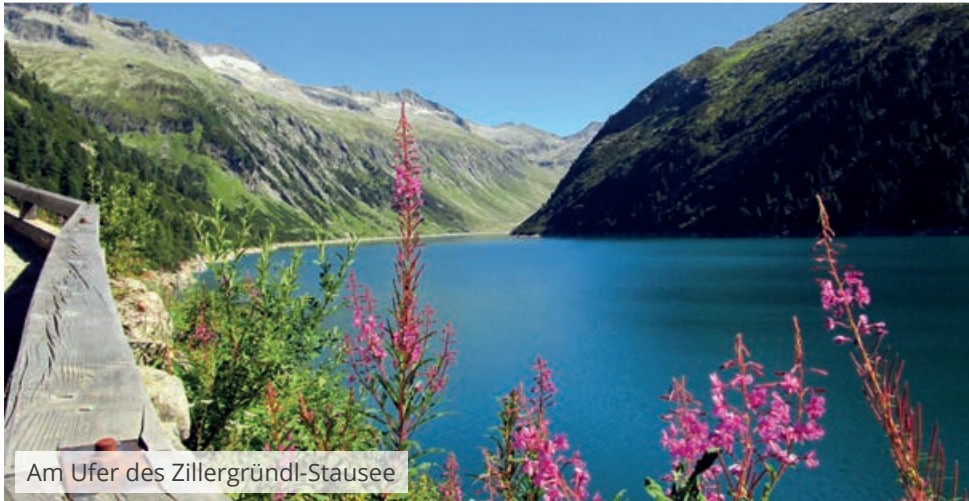
Am Ufer des Zillergründl-Stausee