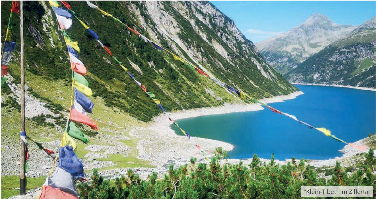
"Klein-Tibet" im Zillertal