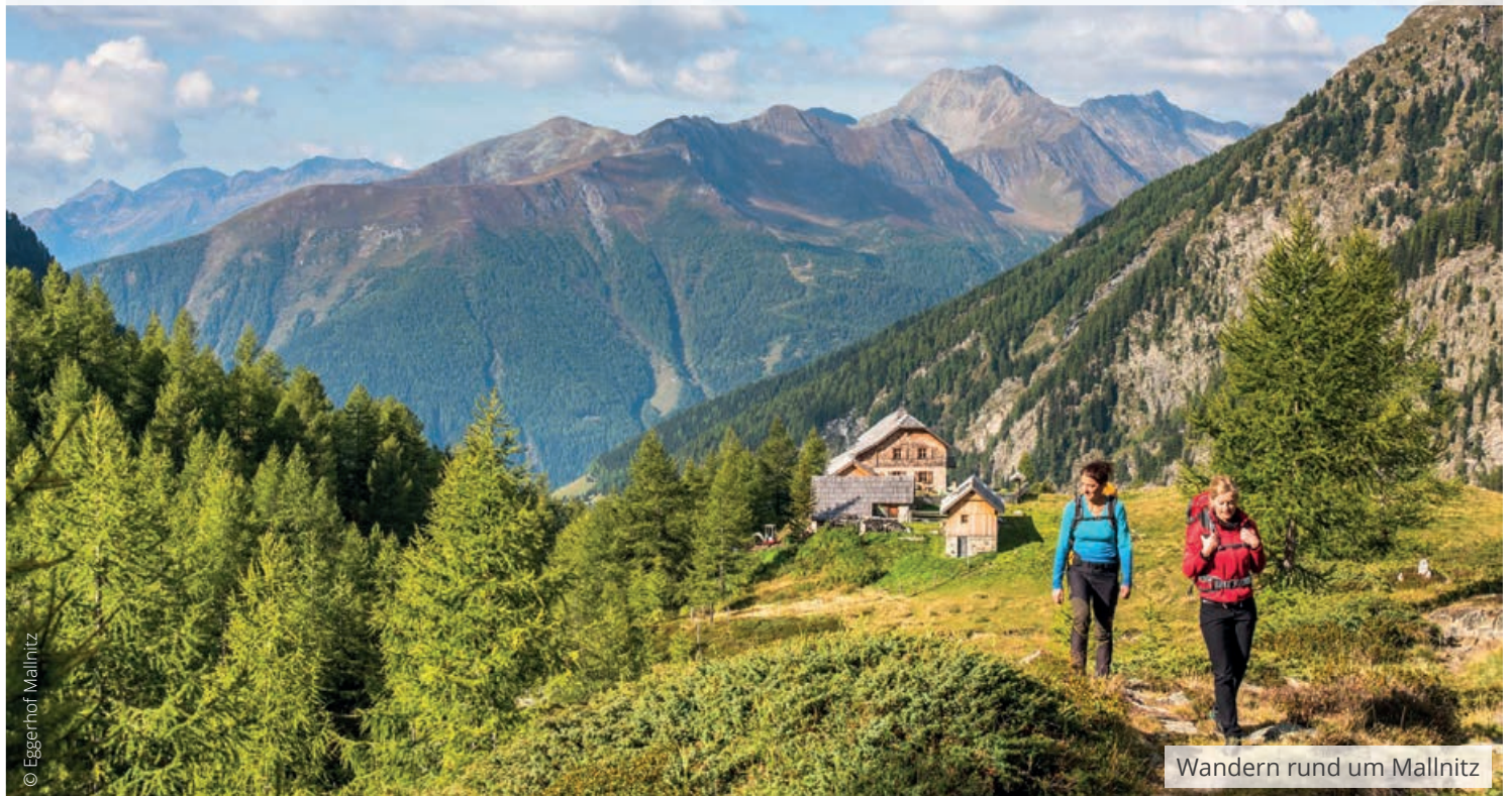
Wandern rund um Mallnitz