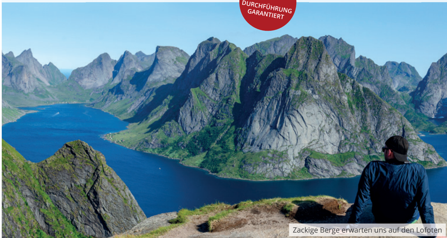
Zackige Berge erwarten uns auf den Lofoten