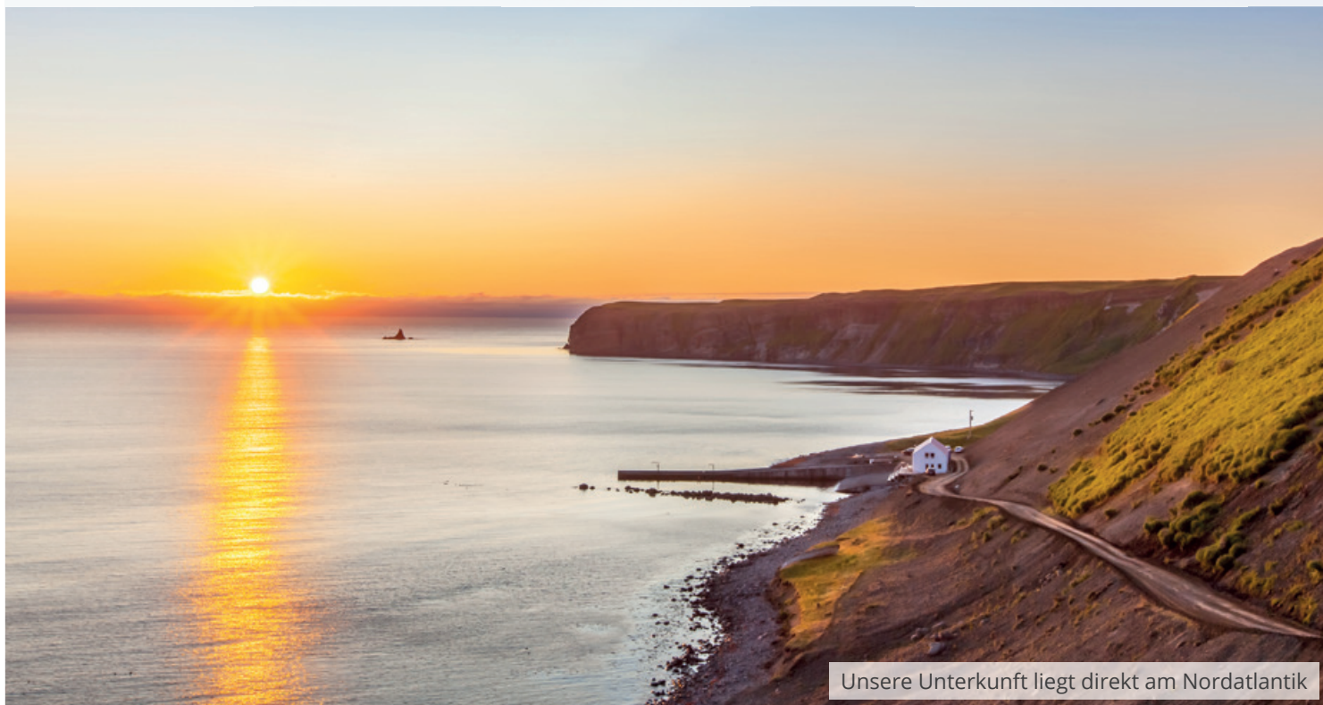
Unsere Unterkunft liegt direkt am Nordatlantik