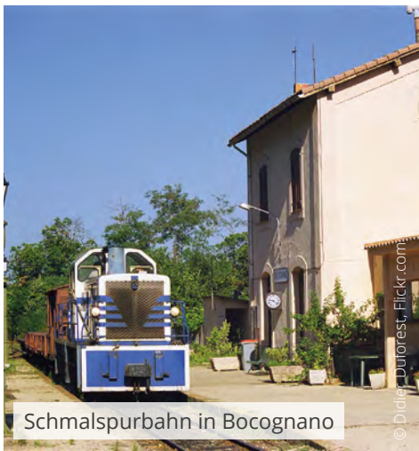
Schmalspurbahn in Bocognano