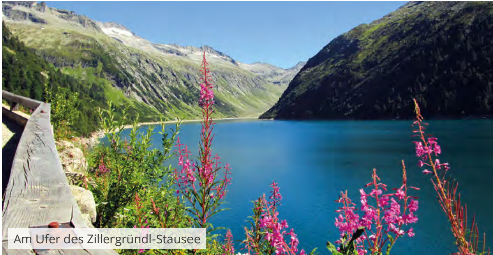
Am Ufer des Zillergründl-Stausee