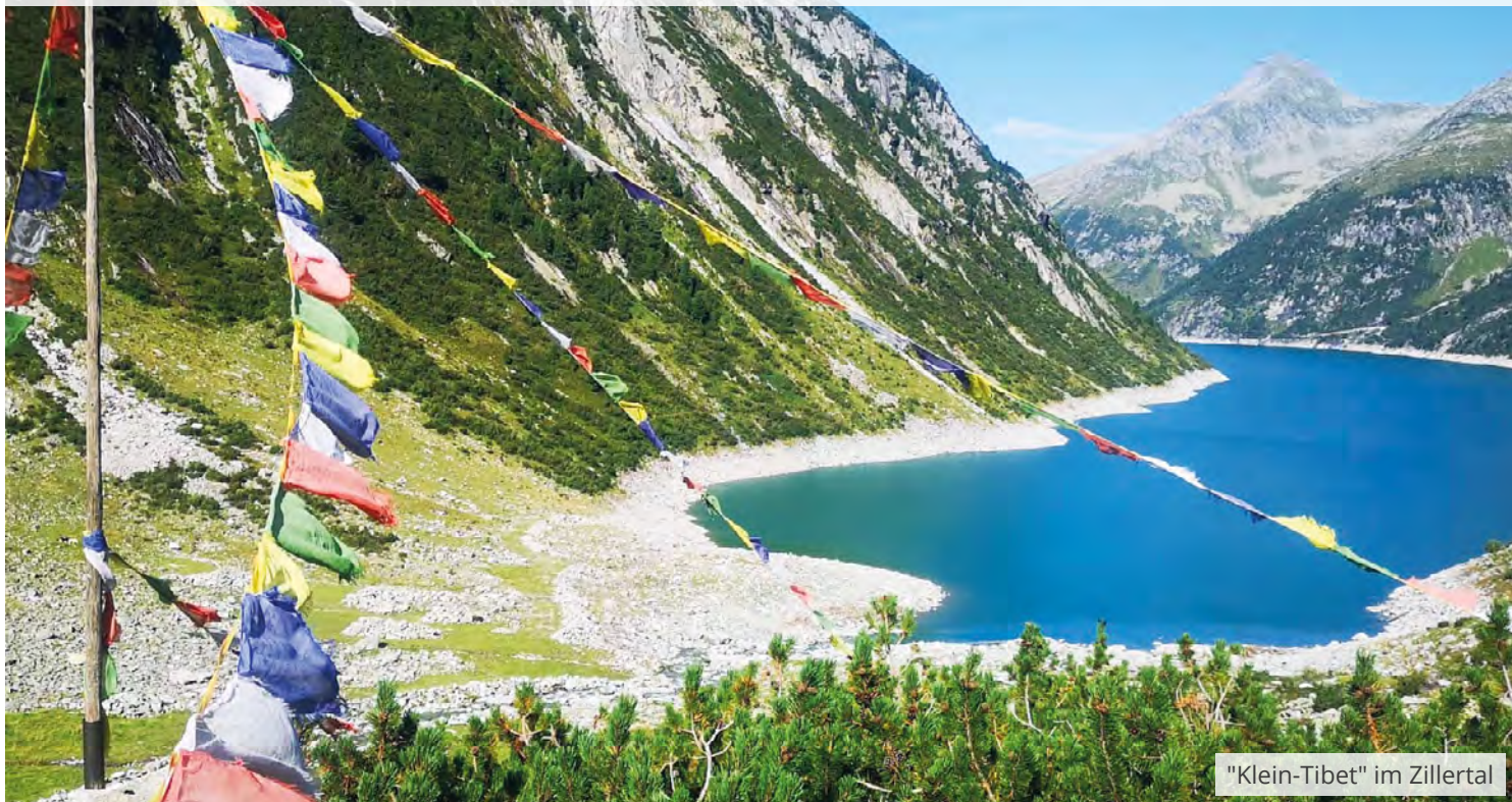
"Klein-Tibet" im Zillertal